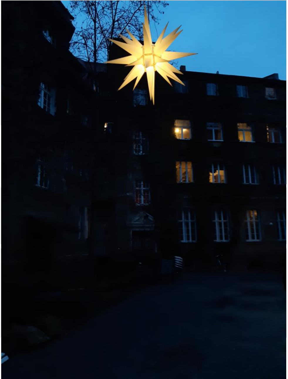
Innenhof Kleine Klausstraße 6+7 mit Stern, Foto: Jutta Noetzel