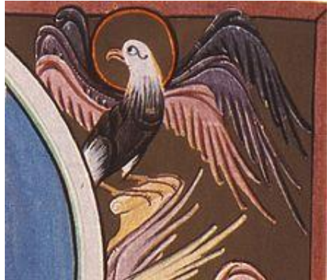
Johannes, Bamberger Apokalypse

Wir wollen auf dem Toralerntag zum Johannes-Evangelium den Verbindungen zu jüdischem Glauben und Denken nachgehen. Auch der manifesten Abgrenzung gegenüber „den Juden“ und der antijüdischen Wirkungsgeschichte soll nachgegangen werden. Dabei sollen uns je eine